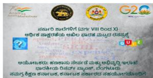
RBI ಅಧಿಕ ಸಾಕ್ಷರತೆ ರಸವತ್ತೆ ಸ್ಪರ್ಧೆ RBI Financial Literacy Quiz Competition