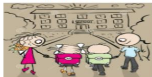
Out of School Children