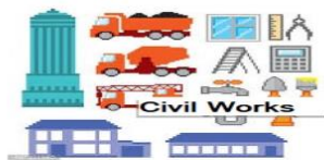
Civil Works (Court Case related)